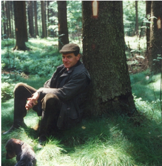
Propriétaire apaisé : sa forêt est bien assurée !