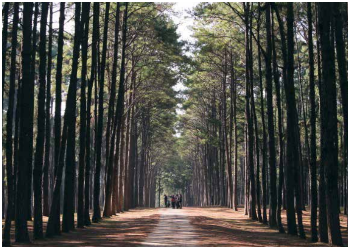
Les arbres sont susceptibles lors d'une chute accidentelle de causer des dégâts aux usagers des routes et chemins

Votre bois est traversé ou bordé par des chemins et sentiers publics. De ce fait les arbres sont susceptibles, lors d'une chute accidentelle, de causer des dégâts aux usagers de ces routes et chemins. Vous êtes responsables de ces dégâts et il est dès lors important de faire assurer votre bois en responsabilité civile.